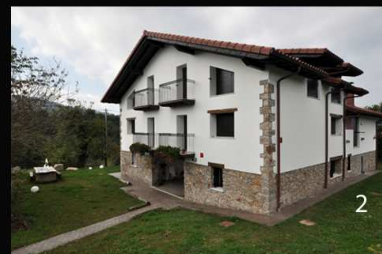
1- Estado inicial 2- Alzado exterior